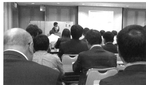
トライボロジー会議や講演もこなせるように