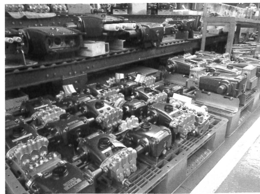
工場では、大量のポンプが出荷の時を待つ